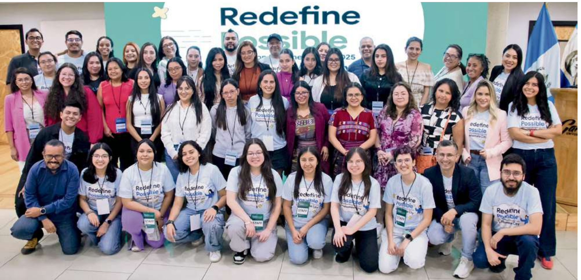
El evento IWD convoca a mujeres jóvenes para escuchar a expertas en diversos temas.