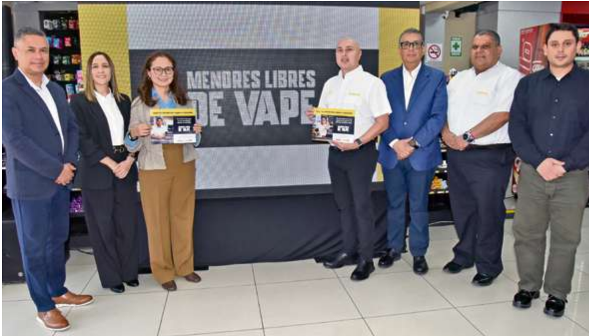
PMI a nivel internacional y TACASA a nivel local tienen una campaña informativa permanente con socios comerciales para prevenir que menores de edad accedan a sus productos.