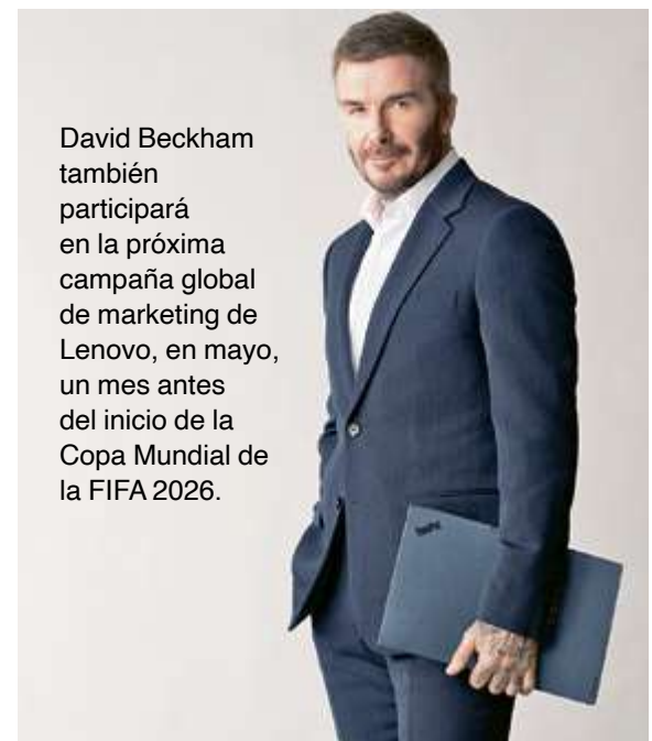
David Beckham también participará en la próxima campaña global de marketing de Lenovo, en mayo, un mes antes del inicio de la Copa Mundial de la FIFA 2026.

Por su parte, el CEO de Lenovo, Yuanqing Yang, destacó que Beckham “entiende el poder de la innovación para transformar el mundo, lo que lo convierte en un socio ideal para demostrar cómo la IA puede mejorar la vida y el trabajo de las personas”.