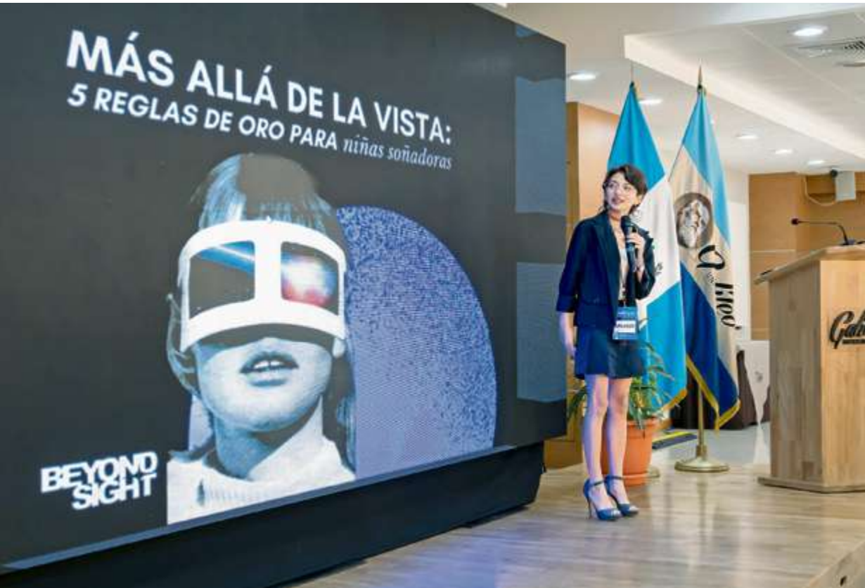
Estas actividades inspiran a las asistentes a seguir con sus sueños y metas.